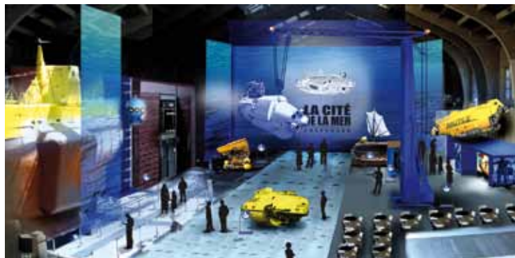
La Grande galerie des engins et des hommes sera ouverte au public à l'automne 2010

concernant les fonds sous-marins, venant ainsi compléter de façon pédagogique et ludique les animations leur étant déjà consacrées. Rappelons qu'un parcours-jeu spécifique existe déjà pour les plus de 7 ans, sans oublier le bassin tactile, moment incontournable de la visite.