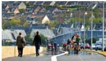
Comme ici à Equeurdreville-Hainneville, les pistes cyclables relient l'Est à l'Ouest de l'agglomération en front de mer

Ce programme, dont la réhabilitation s'étalera dans le temps, prévoit : la continuité et le développement de l'axe structurant Est-Ouest ; l'aménagement de la jonction centre-ville de Cherbourg-Octeville