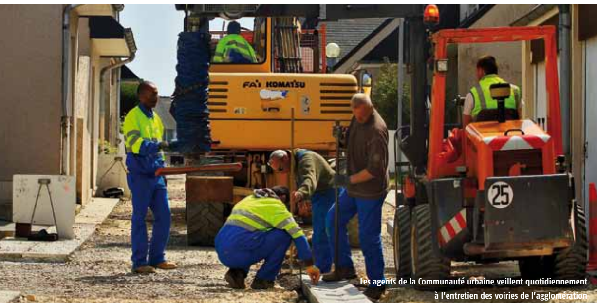
Les agents de la Communauté urbaine veillent quotidiennement à l'entretien des voiries de l'agglomération

Au nombre de ses compétences, la sécurité routière est aussi un enjeu majeur pour la Communauté urbaine. Cette dernière a renouvelé une campagne radio (sur NRJ) de messages destinés aux jeunes. Après une première opération en mars et avant celles d'octobre et de novembre, de nouveaux spots seront diffusés fin juin. Qui dit sécurité, dit aussi respect des règles et du code de la route. Parmi les outils de la Cuc, des panneaux d'information vitesse sont disposés sur le