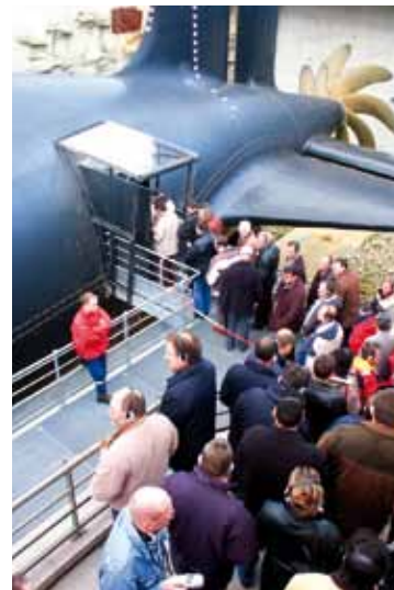
La Cité de la Mer fête les 10 ans d'ouverture au public du Redoutable, début juillet