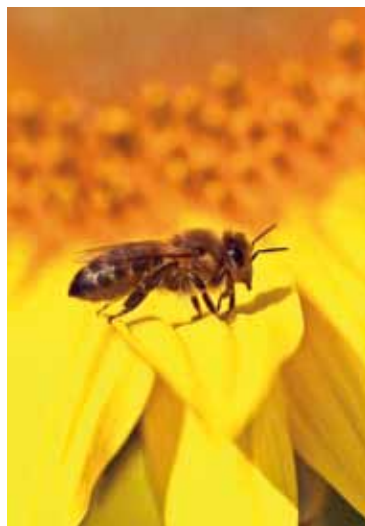
Dans la vallée de Crève-cœur, la première récolte de miel a été un succès.

Coordonné par le Conservatoire des espaces naturels de Basse-Normandie, des directives sur la faune et la flore ont été prises. Pommiers et poiriers ont été plantés, des ateliers auxquels les enfants des écoles ont pu participer. Car le projet de la vallée de Crève-cœur (qui doit son nom au dénivelé de 110 mètres qu'elle abrite), est un projet certes écologique mais surtout social. 6 personnes en