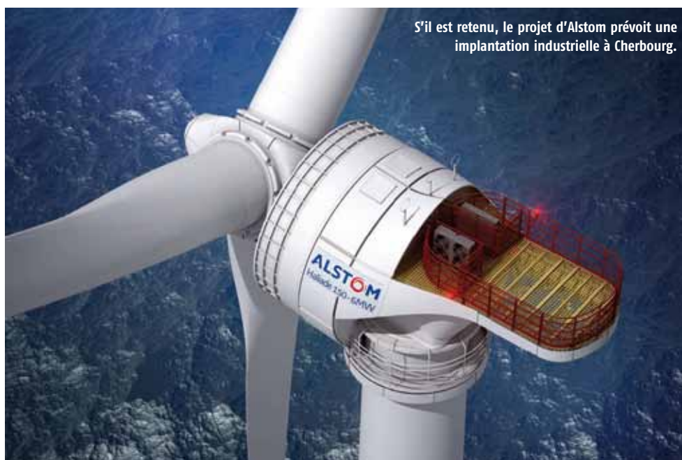
S'il est retenu, le projet d'Alstom prévoit une implantation industrielle à Cherbourg.

Les consortiums en lice ont remis leurs offres à l'Etat dans le cadre du projet éolien off-shore lancé à l'été 2011. Les lauréats seront désignés en avril.