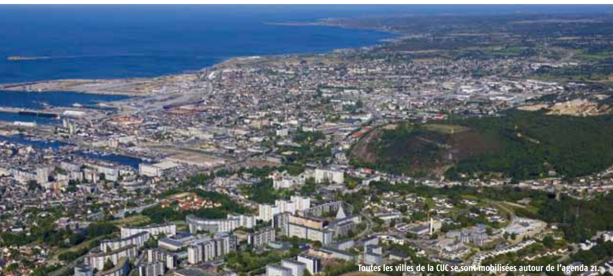
Toutes les villes de la CUC se sont mobilisées autour de l'agenda 21.

Si les premières actions sont déjà menées, si tous les ans un bilan sera établi, si des ajustements et des propositions nouvelles pourront voir le