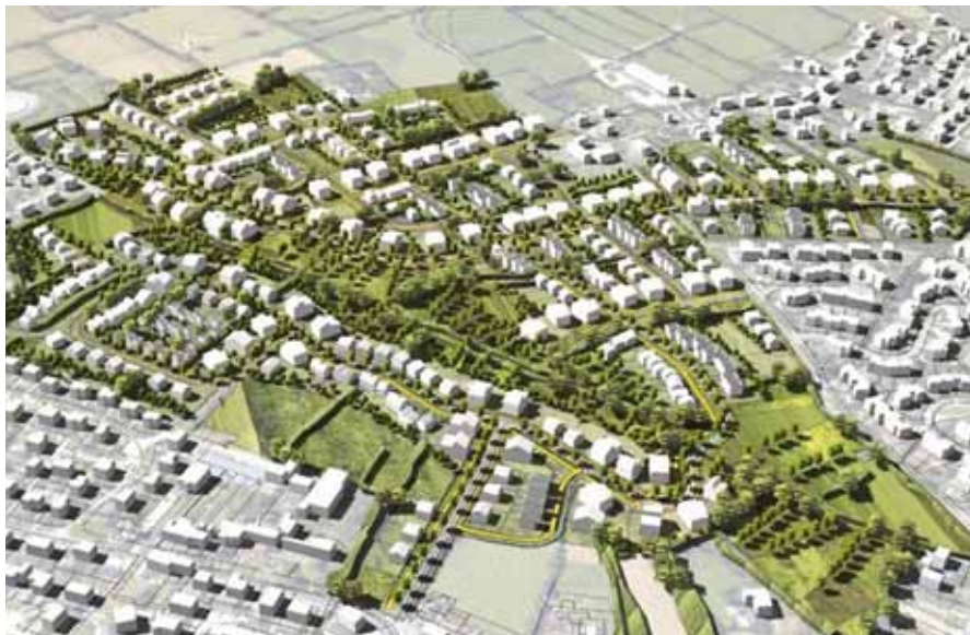
Le projet d'aménagement de la ZAC de Grimesnil-Monturbert