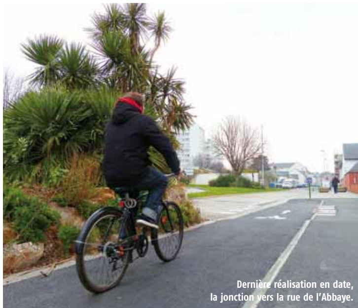
Dernière réalisation en date, la jonction vers la rue de l'Abbaye.

chemin de la Saillanderie à La Glacerie... autant de projets sur lesquels nous reviendrons au cours des prochains mois dans Convergences.