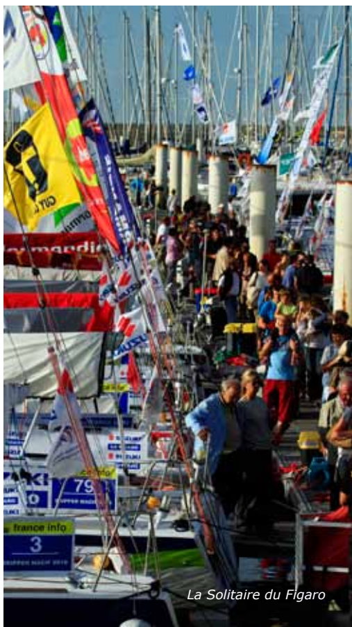
La Solitaire du Figaro

urbaine s'est fortement impliquée dans l'opération en la finançant au titre de la promotion du territoire et du soutien à la filière nautique. Un essai transformé aux côtés de la municipalité, qui en appelle d'autres.