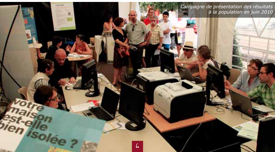
Campagne de présentation des résultats à la population en juin 2010

spécifiques : fin juin lors de deux journées dédiées à l'opération place de Gaulle à Cherbourg-Octeville, fin octobre à la foire-exposition et lors du salon de l'habitat en mars 2011. Près de 2 300 personnes ont ainsi pu se renseigner sur les déperditions de chaleur de leur toiture et éventuellement envisager d'entreprendre des travaux d'isolation. Objectif : réaliser des économies d'énergie, l'une des actions phares de l'Agenda 21.